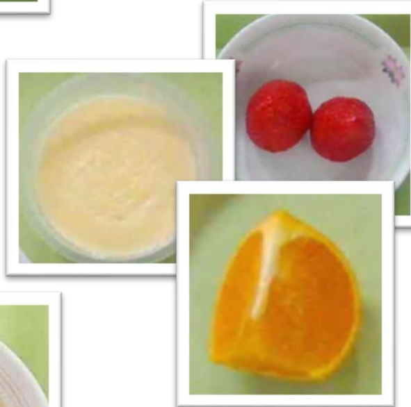
いちご・プリン・せとか