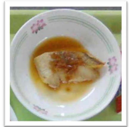
魚の生姜風味焼き