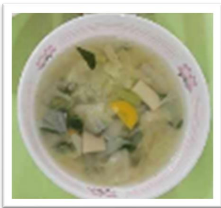
ホールコーンスープ