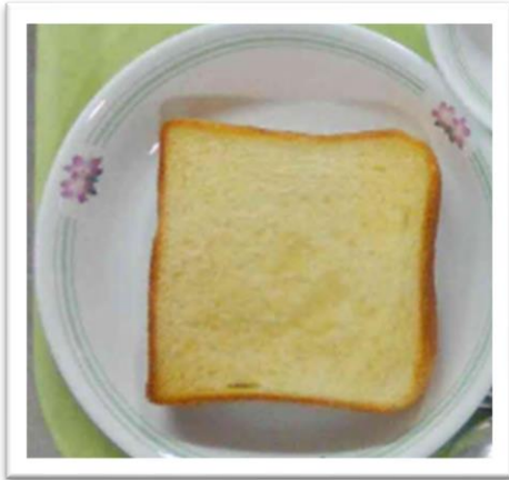
メープルトースト