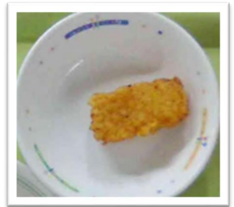
いかの変わり揚げ